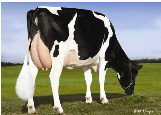
PINE-TREE 2149ROBST 4846 FIFTH DAM